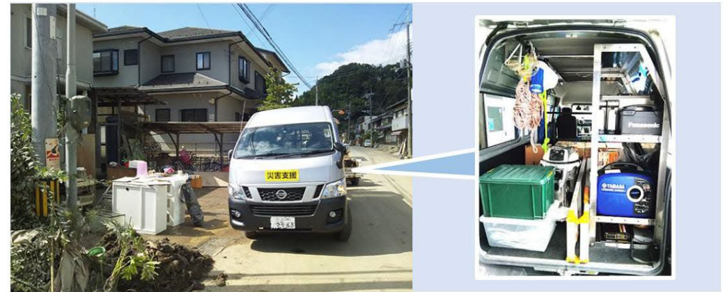
Expédition dans les zones sinistrées

Belmont Communications Corporation, la division de service après-vente du groupe Takara Belmont, a introduit en 2013 des véhicules d'assistance en cas de catastrophe chargés d'appareils spéciaux, notamment des nettoyeurs haute pression et des générateurs, sur la base des expériences et des leçons tirées du grand tremblement de terre de l'est du Japon. En cas d'inondation ou de tremblement de terre, nous pouvons ainsi agir très rapidement pour nos clients touchés afin de les aider à reprendre leurs activités avec notre soutien dédié, afin que ceux qui ont besoin d'un traitement ou d'une coupe de cheveux puissent recevoir la prestation dans les plus brefs délais.