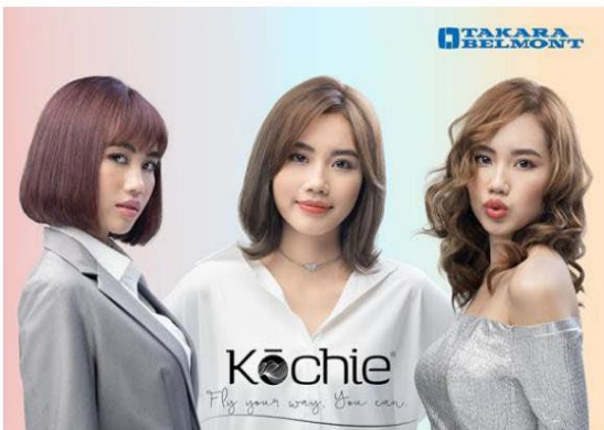
Visuel clé Kochie