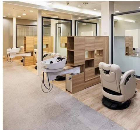
Idée d'espace du salon permettant de créer des chambres privées et semi-privées