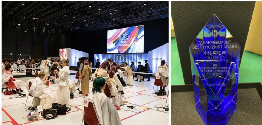
Concours d'identité et création

En 1981, LebeL, notre marque de cosmétiques à usage professionnel, a commencé à organiser régulièrement des concours d'enroulement, une technique utilisée pour les permanentes. Aujourd'hui, à l'image de l'événement appelé "ID", nous soutenons les créateurs et coiffeurs pour améliorer leur créativité. Toujours dans le domaine de la dentisterie, nous offrons aux professionnels dentaires la possibilité de perfectionner leurs compétences techniques en coparrainant le prix du meilleur hygiéniste de l'association japonaise de parodontologie et le prix de l'association japonaise pour le handicap et la prophylaxie de la santé buccodentaire.