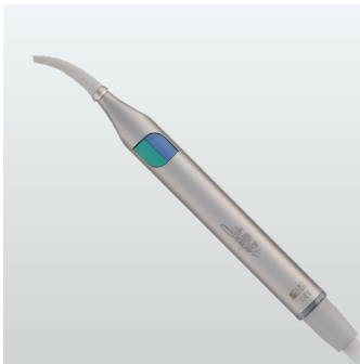
Seringue Luzzani 6-Fonctions