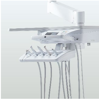
Version 'Place' Type