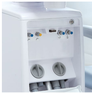
Aspiration Duo (2 filtres à déchets)