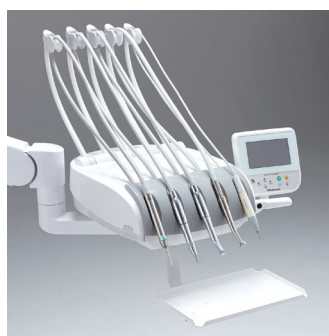
Belmont Rod system (Fouets)