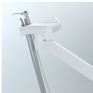
Bras Support Assistante à cliquets (réglable en hauteur)