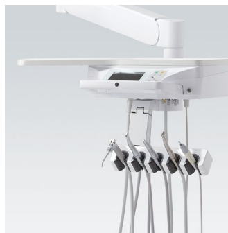
Version 'Holder' (Carquois)