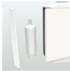
Système autonome sur bouteille de 2 litres