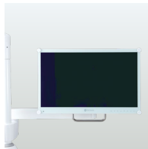
Bras support-écran (sans écran)