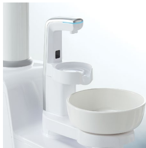
Cellule pour Jet de Verre & Crachoir