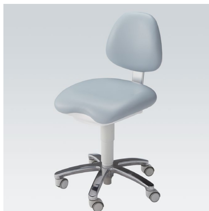
Siège opérateur Eurus (Version inclinable)