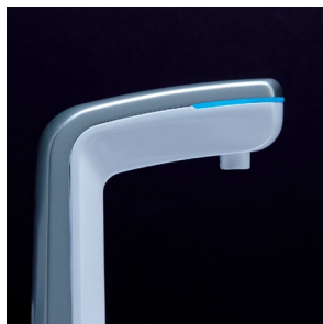
Indicateur à LED