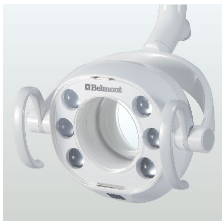
Miroir Patient (En option)