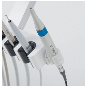
Caméra Intraorale L-CAM HD SHOT