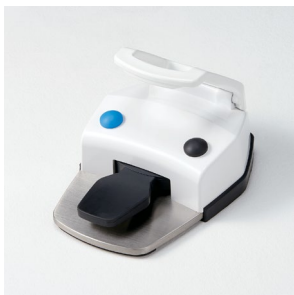
Pédale sans fil