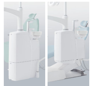
Unit crachoir monté sur le fauteuil / Unit crachoir type Piédestal