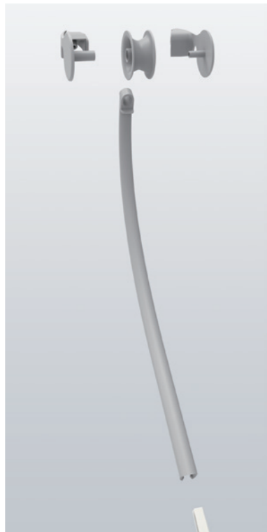
Démontage du fouet Les pièces de d'extrémité du fouet peuvent être facilement démontées pour le nettoyage.

Les conditions d'hygiène à l'intérieur de l'unit sont maintenues par le rinçage des conduites d'eau, de sorte qu'un traitement adapté puisse être administré aux patients. L'unit peut être livré avec un séparateur ou un séparateur avec collecteur d'amalgame, ce qui contribue à faciliter son entretien quotidien.