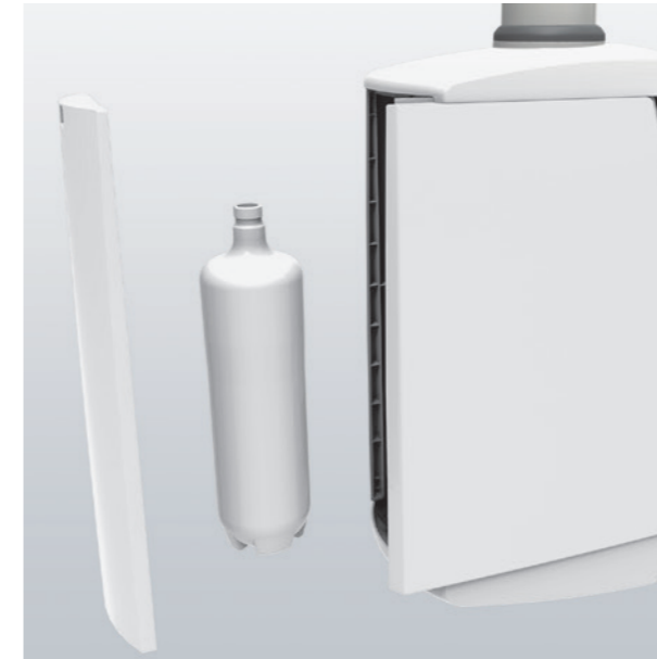
Bouteille d'eau Option