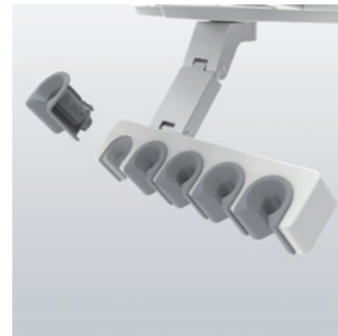
Support autoclavable Les manchons côté dentiste et assistante peuvent être autoclavés et retirés pour le nettoyage.