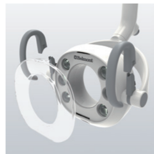
Composants de l'éclairage amovibles poignées autoclavables de l'éclairage et le cache-lentilles peuvent être retirés par l'action d'un simple levier.