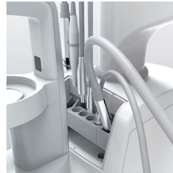
Système de rinçage Option Le système de rinçage intégré des instruments prévient l'accumulation de biofilm et la prolifération bactérienne dans les tuyaux des instruments.