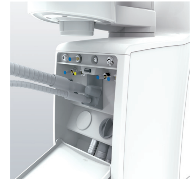
Système de nettoyage de ligne d'aspiration Option L'utilisation quotidienne du système de nettoyage par aspiration intégré empêche l'accumulation de débris dans les conduits d'aspiration et aide à maintenir une aspiration constante.